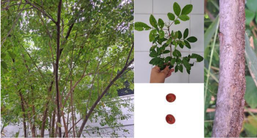
Aroeira-vermelha ( Schinus terebinthifolius )

Figura 01: Conjunto de imagens mostrando a árvore, folhas, flores, semente e caule da Aroeira-vermelha.