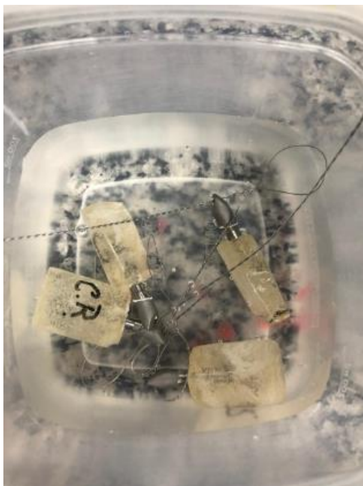
Figura1: Corpos de prova

As 4 amostras foram submetidas a uma força vertical bi-digital de compressão de 3,5 quilos para cimentação dos coping's (Figura 3). Posteriormente os coping's foram cimentados com os dois tipos diferentes de cimento, o cimento resinoso 3M U200 RelyX™ e cimento de zinco SS White, e colocados em uma estufa a 37° por 24 horas imersos em substancia que imita a saliva humana (Figura 4). Por fim sofreram tracionamento vertical com velocidade de 5mm/s em uma máquina universal de ensaios EMIC Modelo: DL 2000 (Figura5).