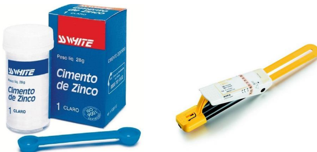
Figura 2: Cimento fosfato de zinco SS White e cimento resinoso 3M U200 RelyX™