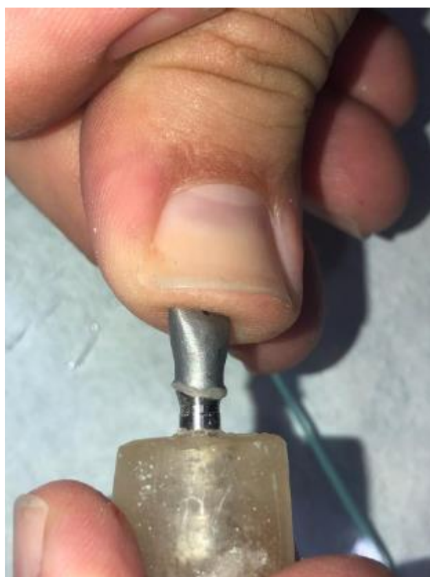
Figura 3: Força vertical