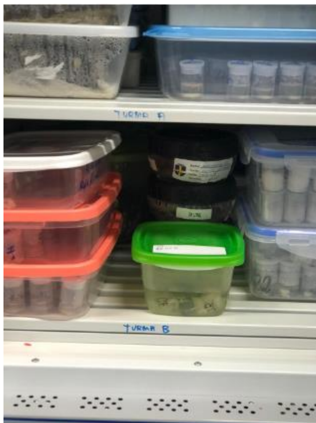
Figura 4: Estufa com as amostras no pote com tampa verde, imerso em saliva artificial