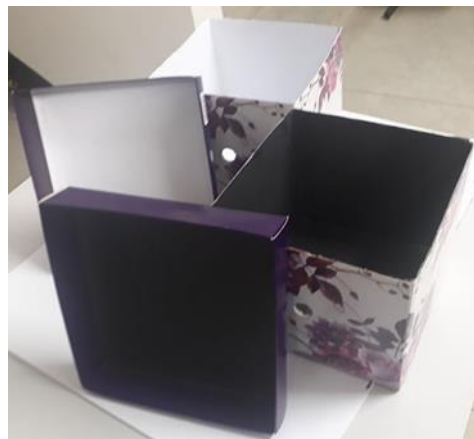
Figura 1: Aparato pronto

Com os materiais selecionados, foi montado o aparato experimental, de forma que o interior das caixas estivesse coberto um com o papel preto e outro com o papel branco. Na parede lateral dessas, foi feito um pequeno orifício da mesma ordem de diâmetro, de forma que permitisse a passagem do soquete bocal (Figura 1).